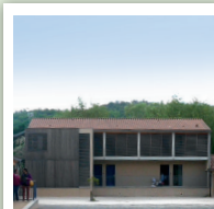
MONTIGNAC-LASCAUX Centre International de Séjour PÉRIGORD