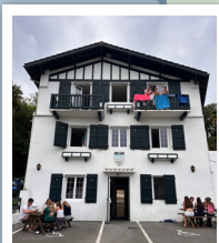
CIBOURE Villa Borda Zahar CÔTE BASQUE