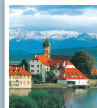
WASSERBURG Centre Franco-Allemand LAC DE CONSTANCE