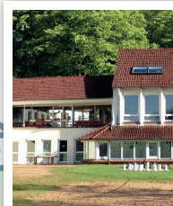
GLÜCKSBURG ADS Schullandheim MER BALTIQUE