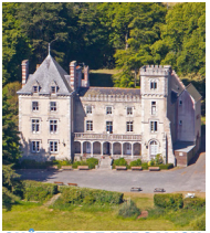
CHÂTEAU DE KERSALIOU Saint-Pol-de-Léon FINISTÈRE