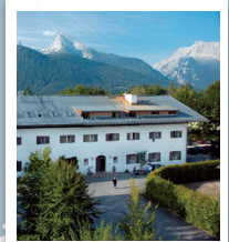
BERCHTESGADEN DJH Jugendherberge HAUTE-BAVIÈRE