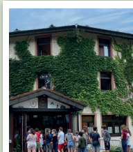
BREISACH DJH Jugendherberge BORDS DU RHIN